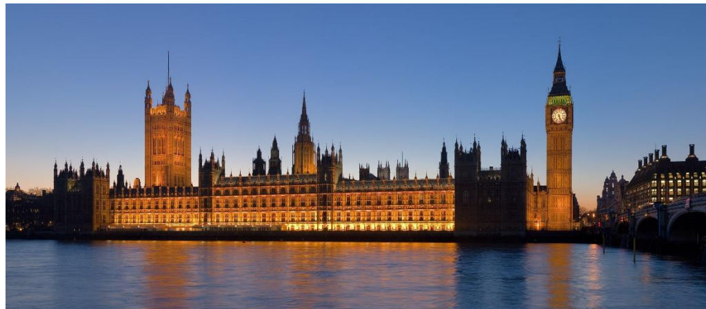
Parlamento da Inglaterra