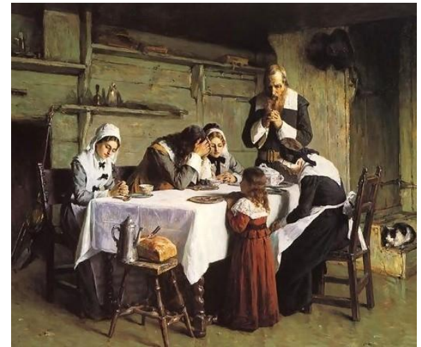
O surgimento do PURITANISMO