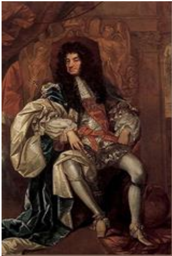
A volta da monarquia Stuart: Carlos II