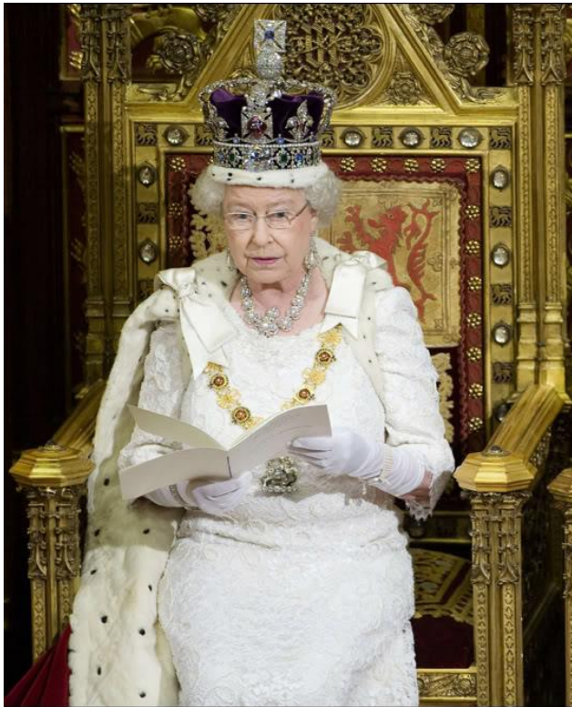
Rainha Elizabeth II

MAS POR QUE AINDA EXISTE UMA RAINHA NA INGLATERRA?